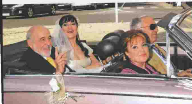
La novia, con un diseño de Jorge Terra, llegó al templo junto a su padre (al lado) y su madre, a bordo de un Buick Skylarck descapotable.

La recién casada cumplió con la tradición: «Lo regalado son las medias, los pendientes y las botas; lo nuevo, el vestido, y lo azul, las ligas».